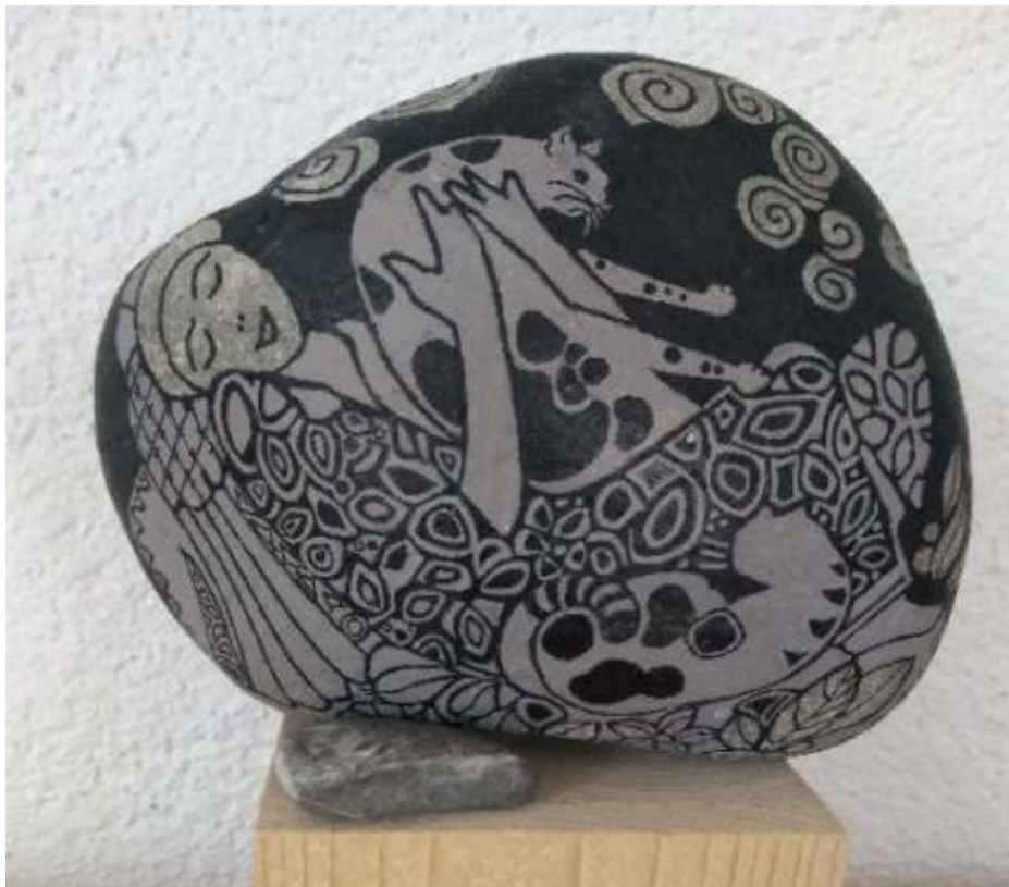
Höhe 22 cm mit Sockel